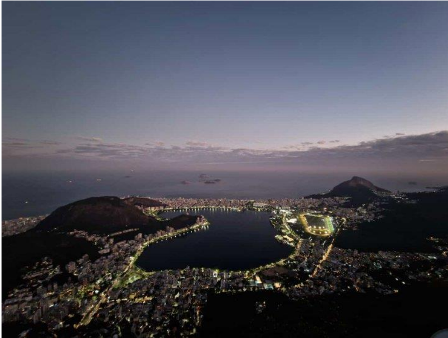
Een prachtig uitzicht over de verlichte stad.