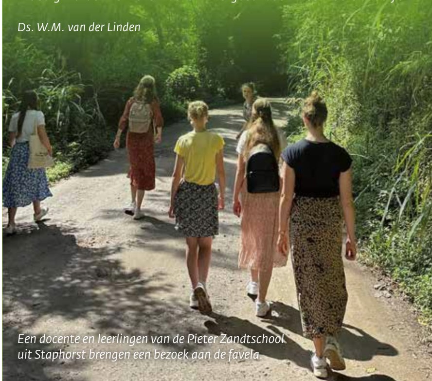
Een docente en leerlingen van de Pieter Zandschool uit Staphorst brengen een bezoek aan de favela.