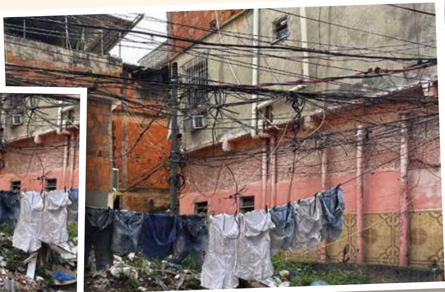
Gebrekkige elektriciteit en haperende apparaten