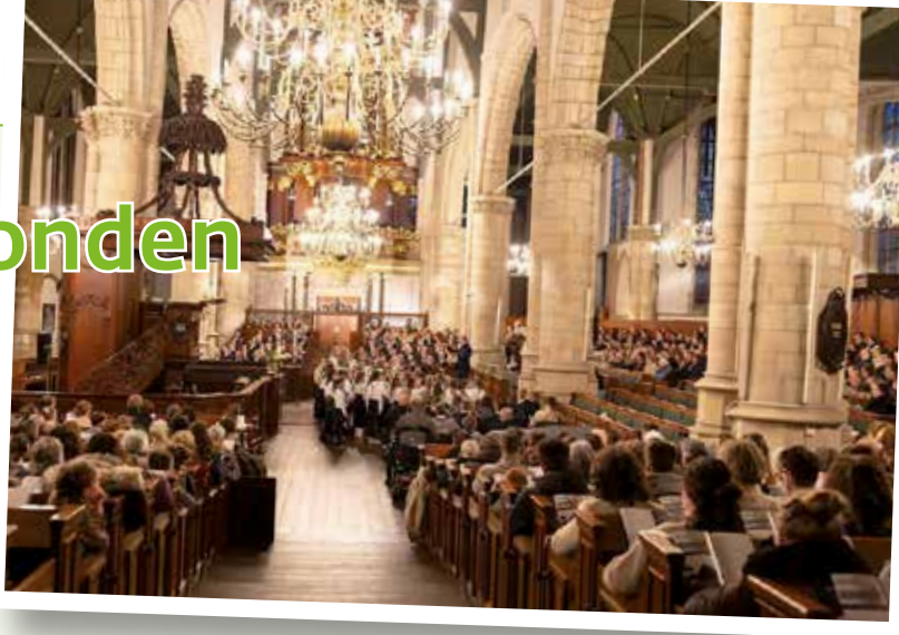
St. Jan in Gouda